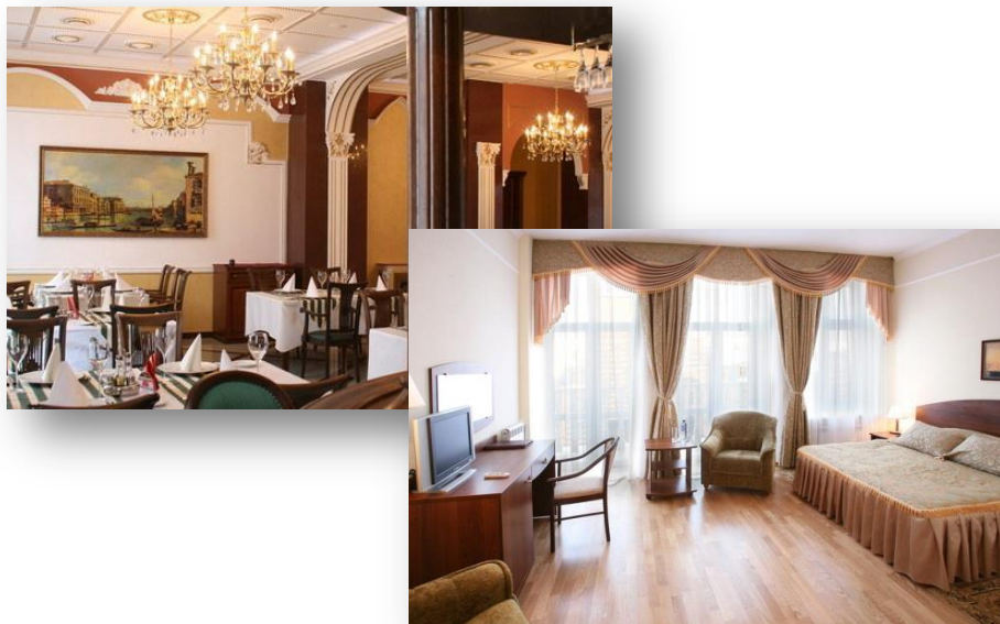
Гостиница «Людовико Моро»

Комфортабельное размещение в гостиницах города или на базе отдыха «Росинка»*